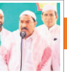
ముస్లింలకు విపెన్ చెబుతున్న సంద్ర