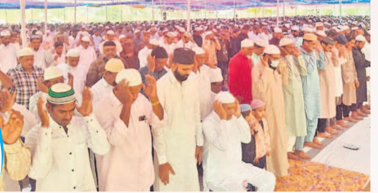
పాల్వంచలో నమాజు ఆచరిస్తున్న ముస్లిం సోదరులు