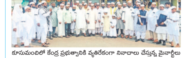
కూసుమంచిలో కేంద్ర ప్రభుత్వానికి వ్యతిరేకంగా నిన్నాదాలు చేస్తున్న మైనార్టీలు

ఖమ్మం, మార్చి 31 (సమస్తి తెలంగాణ ప్రతినిధి): ముస్లిం మైనార్టీలకు వ్యతిరేకంగా వక్కే బోర్డు మార్చిడి బిల్లును తెచ్చేందుకు కేంద్ర ప్రభుత్వం ప్రయత్నిస్తున్నదని ఉమ్మడి ఖమ్మం జిల్లాలోని ముస్లిం మైనార్టీలు ఆరోపించారు. రంజాన్ పండుగ రోజు సోమవారం నల్లబ్యాడ్లను ధరించి కేంద్ర ప్రభుత్వ విధానాలకు వ్యతిరేకంగా నిన్నాదాలు చేస్తూ పలు మండలాల్లో బైక్ ర్యాలీలు, నిరసన ప్రదర్శనలు నిర్వహించారు. ముస్లిం ఆస్తులను కాపాడాల్సిన కేంద్ర ప్రభుత్వం వాటిపై కచ్చేసి స్వాధీనం చేసుకునేందుకు ప్రయత్నిస్తున్నదని ఆరోపించారు. సబ్-కా సాట్, సబ్-కా వికాస్ అనేది కేవలం నిన్నాదంగా మారిందని, ప్రజల మధ్య విచ్చు పెడుతున్న బీజేపీ విధానాలను రాజకీయ పార్టీలు ప్రతిఘటించాలని పలువురు ముస్లిం నేతలు పిలుపునిచ్చారు. కొత్తగూడెం, కూసుమంచి, చంద్రగిరి, అన్న పురెడ్డిపల్లి, అశ్యాపాపేట, బూర్గపహడే, వేంసూరు మండలాల్లో ముస్లింలు ప్రార్థనల అనంతరం నల్లబ్యాడ్లను ధరించి నిరసన తెలిపారు.