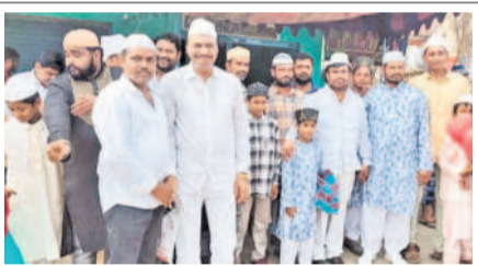
ముస్లింలకు రంజాన్ శుభాకాంక్షలు చెబుతున్న వనమా