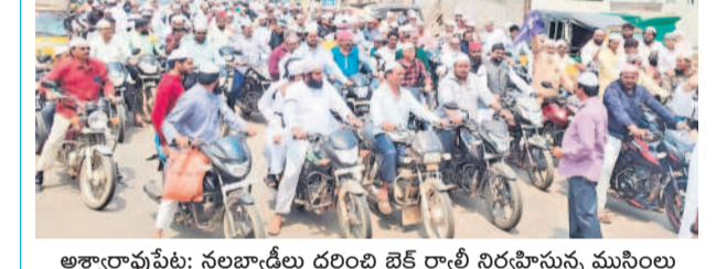
అశ్యాపాపేట: నల్లబ్యాడ్లను ధరించి బైక్ ర్యాలీ నిర్వహిస్తున్న ముస్లింలు

'వక్కే బోర్డు మార్చిడి బిల్లు'కు వ్యతిరేకంగా నిన్నాదాలు