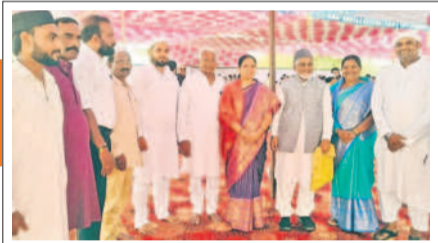
ఇల్లందులో మైనార్టీ సోదరులతో హలిప్రయోనాయక్