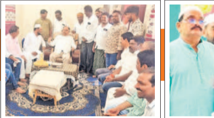
ముస్లింలకు శుభాకాంక్షలు చెబుతున్న కండా