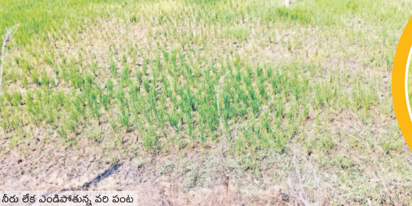
నీరు లేక ఎండిపోతున్న వరి పంట

'అరు గ్యారంటీ' భాగంగా నాలుగు పథకాలను ఇప్పుడు అమలుచేస్తున్నాం. పైబట్టే గ్రామాల్లో ఈ పథకాలను తక్షణమే అమల్లోకి తెచ్చుకున్నాం. మిగతా గ్రామాల్లో మార్చి 31లోగా అమలుచేస్తాం. విస్తృత ప్రాంతం సంబంధం లేకుండా అర్హత ఉండి ఎన్ని ఎకరాల సాగుచేస్తున్న రైతుకైనా మార్చి 31లోపు రైతుభరోసాను జమ చేస్తాం' అంటూ గణతంత్ర దినోత్సవం సందర్భంగా ఈ ఏడాది జనవరి 26న జరిగిన నాలుగు పథకాల ప్రారంభ సభ సాక్షిగా సాక్షాత్తు సీఎం రేవంత్ రెడ్డి రాష్ట్ర ప్రజలకు హామీ ఇచ్చారు. అయితే, పైబట్టే గ్రామాల్లోనే ఆ పథకాల అమలుకు నోచుకోలేదు. ఇక మిగతా గ్రామాల ప్రజలది అదే రిస్కింగ్ లెక్కాంది. అయితే, ఇచ్చిన గడువు మేరకు మార్చి 31లోగా తమకు రైతుభరోసా జమ అవుతుంది.