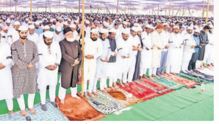
ఖమ్మం నగరంలోని గొల్లగూడెం ఈడ్లాలో ప్రత్యేక నమాజు ఆచరిస్తున్న ముస్లిం సోదరులు