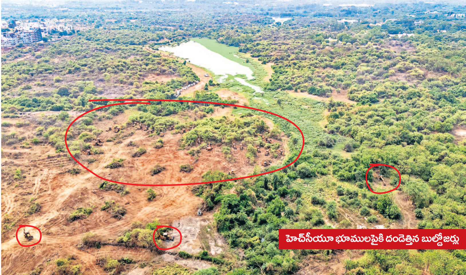
హెచ్సీయూ భూములపైకి దండెత్తిన బుల్డోజర్లు

హఠాత్తుగా, ఆకస్మిక యుద్ధ ప్రకటన చేసినట్లు అర్ధరాత్రి శత్రుదేశంపై మెరుపుదాడికి దిగినట్లు.. శత్రుబీదంపైకి దక్షిణకొద్ది యుద్ధబ్యాంకులను తోలినట్లు.. తెల్లారితే విజయం దక్కడేమోనని ఆదుర్దా పడినట్లు.. చచ్చని మొక్కను ఇనుపబూటతో కర్రశృంగా నలిపేసినట్లు.. హైదరాబాద్ సెంట్రల్ యూనివర్సిటీలో ఆకుపచ్చని అడవి విమిదికి బుల్డోజర్లతో విరుచుకుపడుతున్నది ప్రభుత్వం. బీభత్సకాండను కొనసాగిస్తున్నది. ఒకవైపు విద్యార్థుల పిటిషన్ కోర్టులో విచారణకు రాకముందే.. అదవినంతా తుడిచేయాలని తహతహలాడుతున్నది. 50 జేసీబీలు, 500 మంది పోలీసులను పెట్టి రాత్రి చగలూ తేడా లేకుండా విధ్వంసాన్ని కొనసాగిస్తున్నది ప్రభుత్వం. ఇది సర్కారు కారువిద్యు! ఇది వర్షాల్లో గొడ్డలి వేటు!