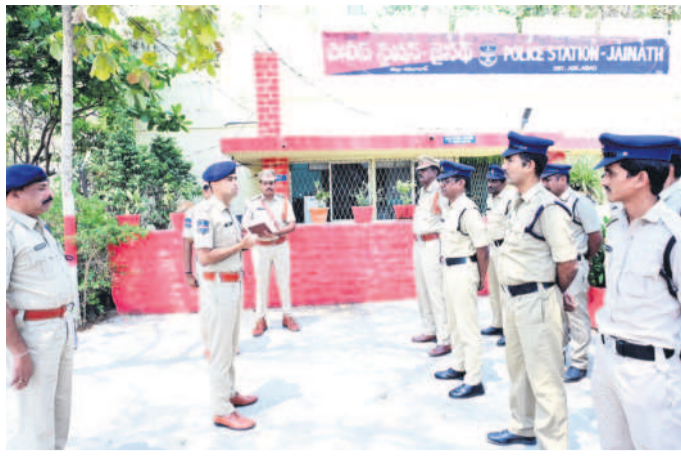
మాట్లాడుతున్న ఆదిలాబాద్ ఎస్సీ అభిలే మహాజన