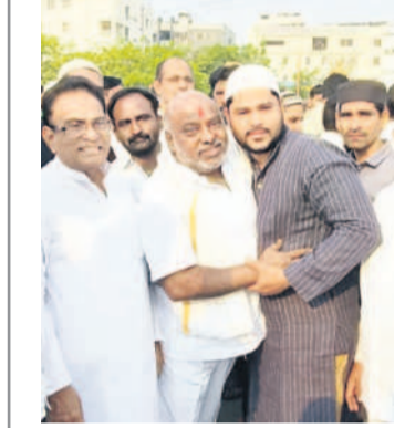
శుభాకాంక్షలు తెలుపుతున్న మాజీ మంత్రి జోగు రామన్న

ఆదిలాబాద్ జిల్లా కేంద్రంలోని ఈడ్ వద్ద ప్రార్థనలు చేస్తున్న ముస్లింలు