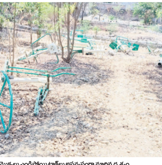
పార్కులోపల మొక్కలు అందిపోయే ట్రాక్లు అస్వస్థంగా మారిన దృశ్యం

ఆదిలాబాద్, మార్చి 31 (నమస్తే తెలంగాణ) : పట్టణవాసుల ఆరోగ్యంతోపాటు ఆహారాభివృద్ధిని ప్రోత్సహించే పాఠశాలలను కల్పించడానికి కేసీఆర్ ప్రభుత్వం ప్రారంభించిన మున్సిపల్ పార్కుల పరిస్థితి పరిస్థితిలోని పలు వాస్తవాలే గల ప్రభుత్వ ఫోటోలలో పార్కులను ఏర్పాటు చేశారు. కాలనీవాసులు ఉదయం, సాయంత్రం వాకింగ్ చేయడానికి ట్రాక్లు, వ్యాయామం చేయడానికి అవసరమైన పరికరాలను అందుబాటులో ఉంచారు. చిన్న పిల్లలు ఆడుకునేందుకు ఆట పరికరాలను ఏర్పాటు చేశారు.