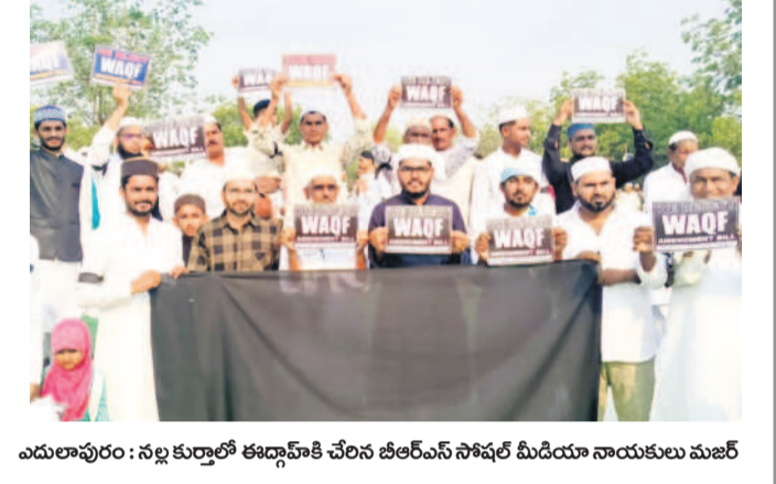
ఎదులాపురం : నల్ల కుర్తలతో ఈడ్ వద్దకి చేరిన డిఎస్సీ సోషల్ మీడియా నాయకులు మజిల్

ఎదులాపురం/ఉట్కూర్, మార్చి 31 : ఆదిలాబాద్ జిల్లావ్యాప్తంగా ముస్లింల వక్స్ బోర్డు సవరణ బిల్లుకు వ్యతిరేకంగా సోమవారం నిరసన తెలిపారు. ఈడ్ వద్ద ప్రత్యేక ప్రార్థనల అనంతరం నల్లబ్యాగ్లను ధరించి ఆందోళన నిర్వహించారు. ఉట్కూర్ డివిజన్ కేంద్రం, ఆదిలాబాద్ జిల్లా కేంద్రంలో ప్రకాశులు ప్రదర్శించారు. అనంతరం మత పెద్దలు మాట్లాడుతూ.. కేంద్ర ప్రభుత్వం మోడీ 3.0లో భాగంగా 2024 ఆగస్టు 8న పార్లమెంట్లో ముస్లింలకు వ్యతిరేకంగా వక్స్ బోర్డు సవరణ బిల్లును ప్రవేశపెట్టడాన్ని తీవ్రంగా వ్యతిరేకిస్తున్నామని అన్నారు. ఈ బిల్లుతో అనవసరమైన అల్లర్లు జరుగుతాయని, స్వాతంత్ర్య భారతదేశంలో అందరూ సామానులే కాబట్టి బిల్లును వెనక్కి తీసుకోవాలని డిమాండ్ చేశారు. కేంద్రం వక్స్ బోర్డును ప్రైవేటీకరణకు ఇవ్వడానికి చట్టం తెచ్చేందుకు చూస్తున్నారని, చట్టాన్ని వెనక్కి తీసుకోకుండా పెద్ద ఎత్తున ఆందోళనలు చేస్తామన్నారు. ఈ కార్యక్రమంలో ముస్లిం మత పెద్దలు, యువకులు పాల్గొన్నారు.