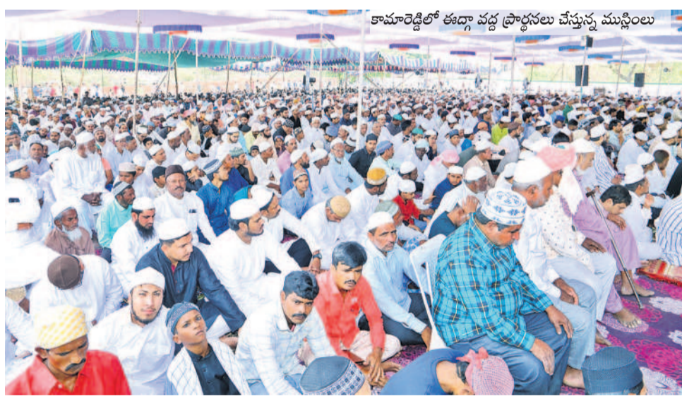
కామారెడ్డిలో ఈడా వద్ద ప్రార్థనలు చేస్తున్న ముస్లింలు