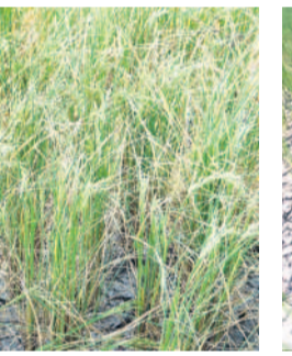
తలమట్టలో నీరలు బాదిన పొలం