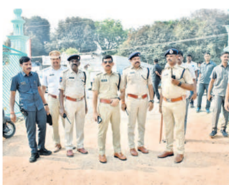
నిజామాబాద్లో ఈడా వద్ద బందోబస్తును పర్యవేక్షిస్తున్న సీపీ సాయి చైతన్య