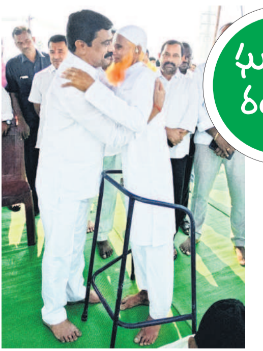
భీమ్గల్లో ముస్లిం పెద్దన ఆలింగనం చేసుకుని రంజాన్ శుభాకాంక్షలు తెలుపుతున్న మాజీ మంత్రి వేముల