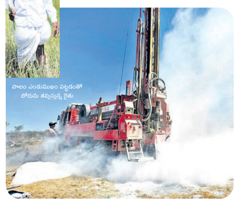
పాలం ఎందుకంటే పట్టడంతో బోరును తవ్వేస్తున్న రైతు