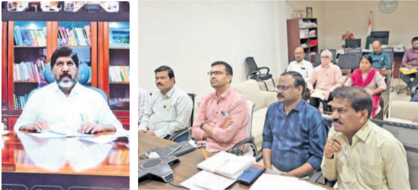
వీడియో కాన్ఫరెన్స్లో మాట్లాడుతున్న ఉపముఖ్యమంత్రి భట్టి విక్రమార్క కాన్ఫరెన్స్లో హాజరైన వికారాబాద్ కలెక్టర్ ప్రదీప్ జైన్, సంబంధిత శాఖల అధికారులు

రాష్ట్ర ఉపముఖ్యమంత్రి మల్లూ భట్టి విక్రమార్క