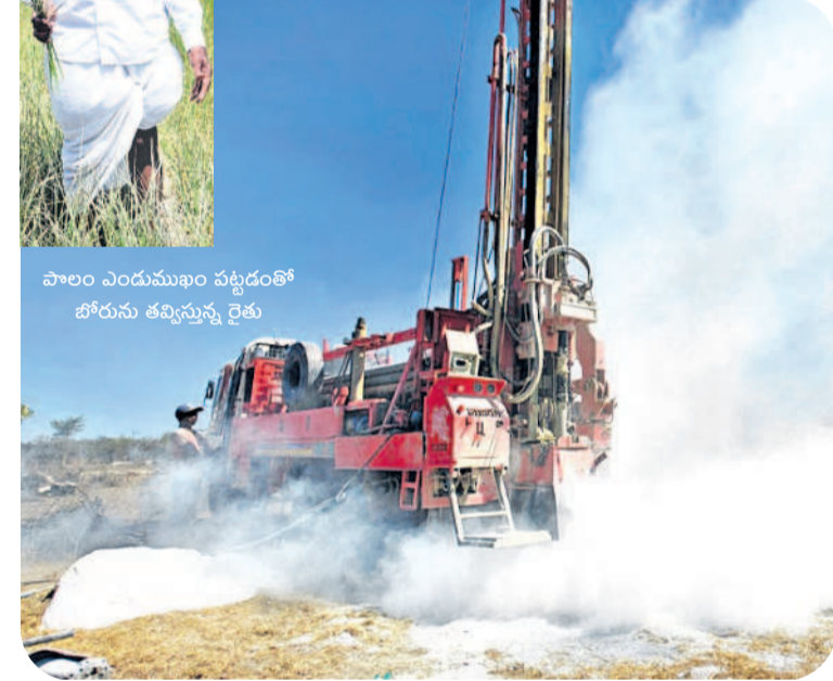
పాలం ఎందుకంటే పట్టడంతో బోరును తవ్విస్తున్న రైతు

నాలుగు బోర్లు తవ్వించినా చుక్కనీరు లేదు.. నాకు ఎనిమిది ఎకరాల పొలం ఉండగా.. అందులో నాలుగు బోర్లు తవ్వించా. అయినా బోర్లు వట్టిపోయి పరి పంట ఎండిపోయింది. ఒక్క బోరులోనూ చుక్క నీరు రాలేదు. అప్పులే మిగిలాయి.