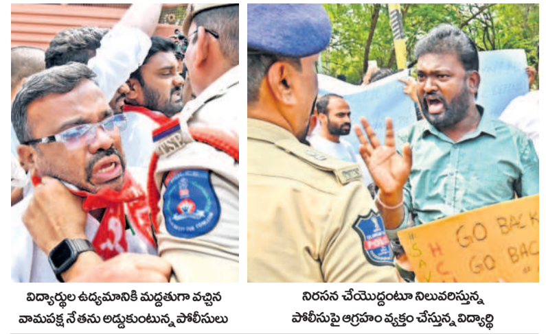
విద్యార్థుల ఉద్యమానికి మద్దతుగా వచ్చిన వామపక్ష నేతను అడ్డుకుంటున్న పోలీసులు