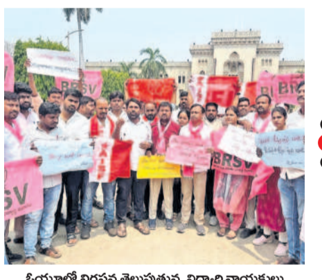
ఓయూలో నిరసన తెలుపుతున్న విద్యార్థుల నాయకులు