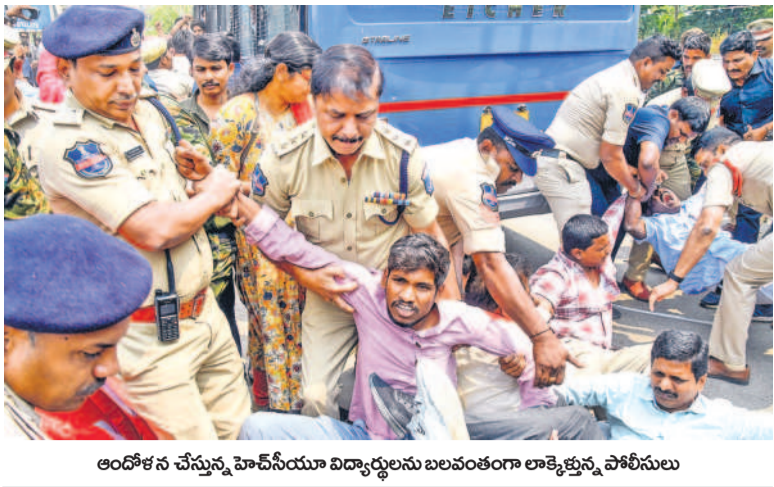
ఆందోళన చేస్తున్న హెచ్సీయూ విద్యార్థులను బలవంతంగా లాక్కెళ్లిన పోలీసులు