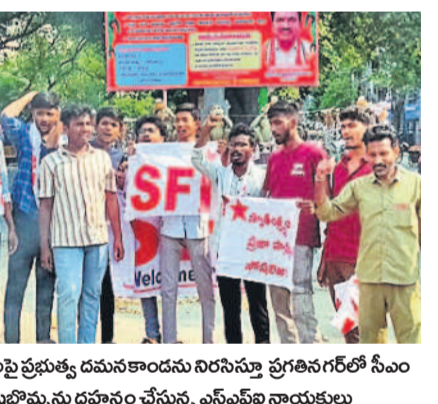
హెచ్సీయూ భూములపై ప్రభుత్వ దమనకాండను నిరసిస్తూ ప్రగతి నగర్లో సీఎం రేవంత్ రెడ్డి దిష్టిబొమ్మను దహనం చేస్తున్న ఎన్ఎఫ్పి నాయకులు