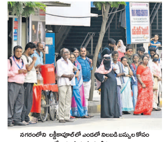
నగరంలోని లక్ష్మీపూల్ లో ఎండలో నిలబడి బస్సుల కోసం వేచిచూస్తున్న ప్రయాణికులు