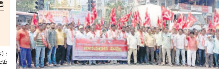
సిరిసిల్ల జిల్లా శేండ్లలోనే నేతన్న చౌరస్తాలో ధర్మా చేస్తున్న నేతన్నలు