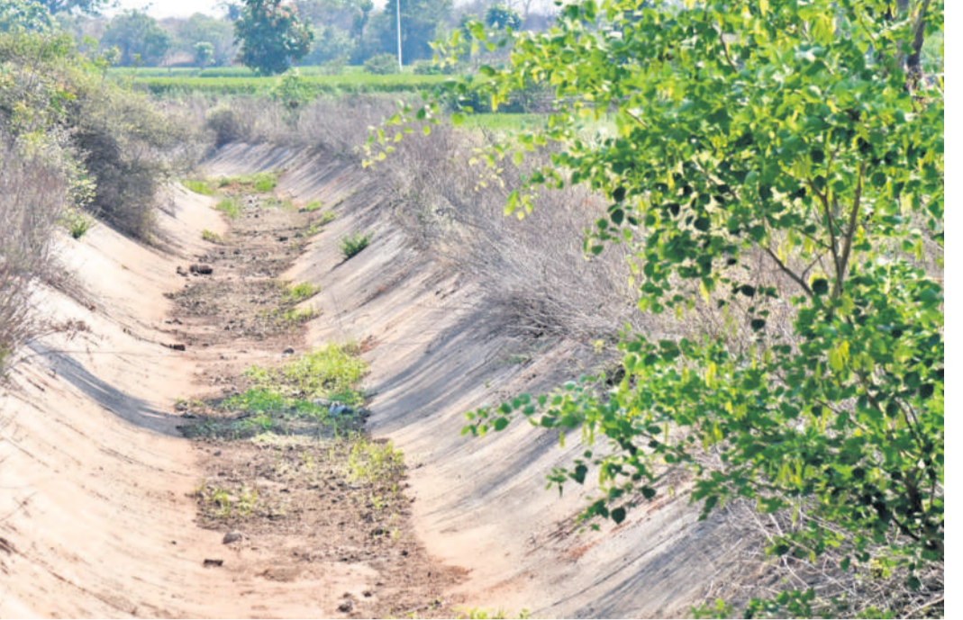
మక్కనీరు లేక వెలవెలబోతున్న సిద్దిపేట రూరల్ మండలం మాచాపూర్ నీళ్లు వచ్చే రంగనాయకసాగర్ కెనాల్

సంగాడెడ్ జిల్లా కంది మండల కేంద్రంలో పరి రోజులుగా నీటి సరఫరా లేక ప్రజలు తీవ్ర ఇబ్బందులకు గురవుతున్నారు. కిలోమీటర్ల మేర వెళ్లి నీటిని తెచ్చుకోవాల్సిన పరిస్థితి ఎద్దడిచేస్తూ మంగళవారం గ్రామ పంచాయతీ కార్యాలయం ఎదుట ఖాళీ బండెలతో బైరాయింపి ధర్మా చేపట్టారు. పరి రోజులుగా తాగునీరు, వాడుకోవడానికి నీళ్లు లేక సరకయాతన అనుభవిస్తున్నామని, వెంటనే సమస్యను పరిష్కరించాలని డిమాండ్ చేశారు. - కంది