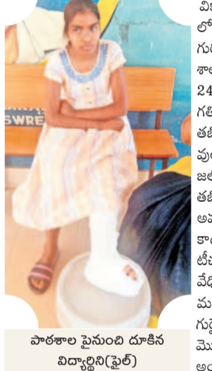
పాఠశాల పైనుంచి దూకిన విద్యార్థిని (ఫైల్)

వికారాబాద్ లోని కొత్తగడి గురుకులం పాఠశాలలో ఫిబ్రవరి 24న 10వ తరగతి విద్యార్థిని తిట్టడంతో ఆత్మహత్యాయత్నం చేసుకున్నది. విద్యార్థుల పట్ల దురుసు ప్రవర్తనను మానుకోవాలని స్పీకర్ గడ్డం ప్రసాద్ కుమార్ హెచ్చరించారు. మరొక స్త్రీ బాలిక తరవాత విద్యార్థిని పట్టుకుంటూ.. ప్రిన్సిపాల్ చెప్పడంతో పాటు తోటి విద్యార్థులతో కొట్టించింది. దీంతో విద్యార్థికి జ్వరం రావడంతో తల్లిదండ్రులకు సమాచారం అందింది ఇంటికి పంపించారు. టీచర్ కొట్టి.. విద్యార్థులతో కొట్టించింది విద్యార్థి చెప్పడంతో బాలుర గురుకులం పాఠశాల తీర్పు తల్లిదండ్రులు మండిపడ్డారు. చైర్మన్, పోలీస్ స్టేషన్లో సైతం ఫిర్యాదు చేశారు. ప్రిన్సిపాల్ హామీతో సమస్య సద్దుమణిగింది.