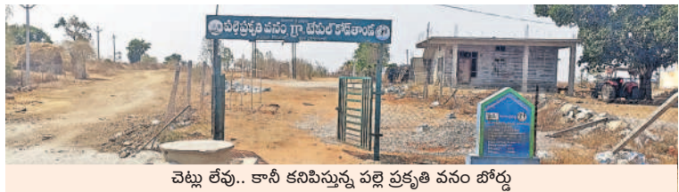
వెళ్ళు లేవు.. కానీ కనిపిస్తున్న పల్లె ప్రకృతి వనం బోర్డు