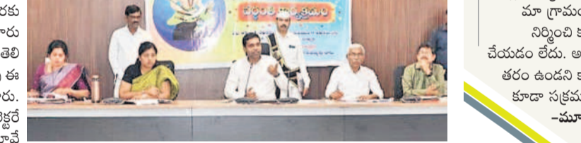
మాట్లాడుతున్న ఖమ్మం కలెక్టర్ ముజమ్మిల్ ఖాన్

మండల స్థాయి అధికారులతో ఏర్పాటుచేసిన సమీక్షలోనూ ఆయన మాట్లాడుతూ, నిరుద్యోగి యువత యువకులు స్వయం ఉపాధి పొందేందుకు రూ.50 వేల నుంచి రూ. 4 లక్షల వరకు వివిధ యూనిట్లు మంజూరు చేయనున్నట్లు చెప్పారు. ఎంచుకున్న సెక్టార్లు, వ్యాపారాల వారీగా ఎంపికైన అభ్యర్థులకు శిక్షణ ఇస్తామన్నారు. బ్యాంకు లింకేజీ రుణాలు కూడా తప్పనిసరిగా మంజూరయ్యేలా చర్యలు తీసుకుంటామని అన్నారు. అలాగే, తెల్ల రేషన్ కార్డు ఉన్న లబ్ధిదారులకు వౌకరుకాకాలో ఉచితంగా సన్న బియ్యం సరఫరా చేసేందుకు చర్యలు చేపట్టామన్నారు. సన్న బియ్యం పక్కదారి పట్టడానికి వీలు లేకుండా చర్యలు తీసుకుంటామన్నారు. అల్పదారులకు నాణ్యత లేని సన్న బియ్యం అందిస్తూ కలిసి చర్యలు తప్పనిసరిగా తీసుకోవాలని కోరారు. తీసుకోవాలని కోరారు. తీసుకోవాలని కోరారు.