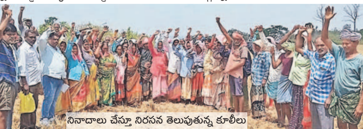
నినాదాలు చేస్తూ నిరసన తెలుపుతున్న కూలీలు