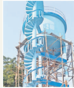
చుంచుపల్లి: నిర్మాణం పూర్తి అయిన మిషన్ భగీరథ ట్యాంకు