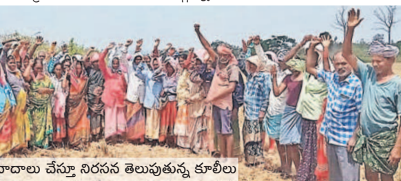
నినాదాలు చేస్తూ నిరసన తెలుపుతున్న కూలీలు