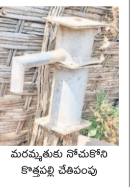
మరమ్మత్తుకు నోచుకోని కొత్తపల్లి చేతిపంపు

చర్ల మండల ప్రజలకి మరింత దయ నీరు పరిస్థితి. కాంగ్రెస్ ప్రభుత్వ నిర్లక్ష్యం కారణంగా గోదారి ఒడ్డున ఉన్న గ్రామాల ప్రజలకు కూడా గొంతెండుతున్న స్థితి. ఈ మండలంలోని కొత్త పల్లి గ్రామం గోదారి నది ఒడ్డునే ఉంటుంది. అయిప్పటికీ బోర్లలో నీళ్లు అడుగుంటాయి. అందుకు ప్రత్యామ్నాయంగా మిషన్ భగీరథ ద్వారా తాగునీటిని అందించాలన్న కాంగ్రెస్ ప్రభుత్వం.. ఆ దిశగా చర్యలు తీసుకున్న పాపానపోవడం లేదు. భగీరథ ద్వారా కేవలం అంతంతమాత్రంగానే తాగునీటిని సరఫరా చేస్తూ చేతులు దులుపుకుంటోంది. కనీసం మూలనపడ్డ బోర్లకు మరమ్మత్తులు కూడా చేయడం లేదు. అయితే, తమకు తాగునీరు అందించాలని కోరుతూ ఆర్.కొత్త గూడెం, కలివేరు గ్రామాల ప్రజలు ఇటీవల రోడ్లెక్కి అందోహేను చేసినా ఆది అరణ్య రోదనగానే మిగిలిపోయింది. ఇక పంటలకు సాగునీళ్లు అందించే అందోహేను అధికారులు నిర్లక్ష్యాన్ని ప్రదర్శిస్తోంది. అన్నదాతలు సాగు చేస్తున్న మిర్చి, పరి పంటలు ఎండిపోతూన్న సర్కారు నుంచి స్పందన ఉండడం లేదు. ప్రభుత్వం పట్టించుకోకపోవడంతో తమ పంటలు కాపాడుకునేందుకు అనేక తంటాలు పడుతున్నారు. కొందరు రైతులైతే ట్యాంకర్లతో నీటిని తెచ్చి పొలాలకు పెట్టుకుంటున్నారు. అంత అబద్ధ భరించలేని రైతులు.. ఎండిపోతున్న పంటలను చూసి తల్లడిల్లిపోతున్నారు. లింగాపురంపాడు, పాక చర్ల వెళ్ల చెరువులు అడుగుంటడంతో దిక్కుతోచని స్థితిలో ఆలలు పడుతుంటున్నారు.