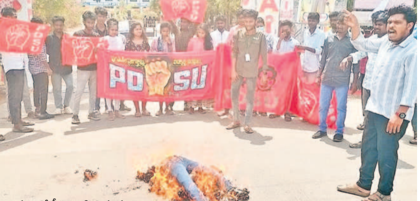
ఖమ్మంలో సీఎం రేవంత్ రెడ్డి దిష్టిబొమ్మను దహనం చేస్తున్న పీడీఎస్యూ నేతలు