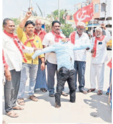
ఎల్లపాలెంలో ముఖ్యమంత్రి దిష్టిబొమ్మను దహనం చేస్తున్న సీపీఎం నాయకులు

-ఖమ్మం, ఏప్రిల్ 2 (సమస్తే తెలంగాణ ప్రతినిధి)/భద్రాద్రి కొత్తగూడెం (సమస్తే తెలంగాణ ఇల్లెందులో..)