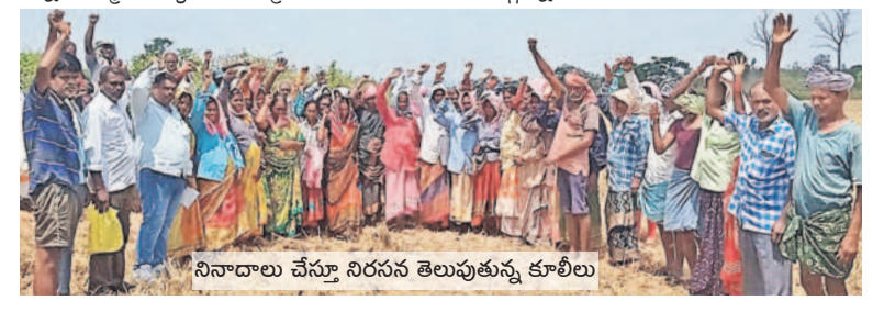
నినాదాలు చేస్తూ నిరసన తెలుపుతున్న కూలీలు