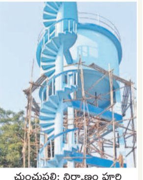
చుంచుపల్లి: నిర్మాణం పూర్తి అయిన మిషన్ భగీరథ ట్యాంకు

భద్రాద్రి జిల్లా చుంచుపల్లి మండలాన్ని పరిశీలిస్తే.. భగీరథ పథకంపై కాంగ్రెస్ ప్రభుత్వానికి ఎంత చిన్నచూపు ఉందో అర్థమవుతోంది. ఈ మండలంలోని సందాతండాలో గత కేసీఆర్ ప్రభుత్వం మిషన్ భగీరథ వాటర్ ట్యాంకును నిర్మించింది. వీడివీడికి పైవులపై వేసింది. ప్రతి ఇంట్లోనూ నల్లలు బిగించింది. వాటికి కనెక్షన్లు ఇచ్చే సమయానికి కేసీఆర్ ప్రభుత్వం మారినది. కాంగ్రెస్ ప్రభుత్వం కొలుపుదీరింది. సరిగ్గా అప్పటి నుంచే ఈ గ్రామ ప్రజలకు తాగునీటి కప్పాలు మొదలయ్యాయి. నిర్మించి సిద్ధంగా ఉన్న మిషన్ భగీరథ ట్యాంకును మూలనపడేసింది. నల్లల కనెక్షన్లను నల్లలు ముందించింది. దీంతో గత కేసీఆర్ ప్రభుత్వం నోటి కాడి దాకా తెచ్చిన తాగునీటిని కాంగ్రెస్ ప్రభుత్వం కాలదన్నుపట్టుకుంది గ్రామస్థులు అవే దిన వ్యక్తం చేస్తున్నారు. భగీరథ ట్యాంకు నిండా నీళ్లు నింపిన అధికారులు.. ఇళ్లకు మాత్రం సరఫరా చేయడం లేదని ఆరోపిస్తున్నారు. ఇదే విషయమై మిషన్ భగీరథ ఏకా వసంత కుమారిని వివరణ కోరగా.. పైవులపై గతంలోనే వేశామని, ట్యాంకులో నీటిని కూడా నింపామని అన్నారు. అయితే, ఇళ్లలోని నల్లలతో వాటికి కనెక్షన్లు ఇవ్వాలి ఉందని అన్నారు. దీనికి రెండు మూడు రోజుల సమయం పడుతుందని, త్వరలోనే సందా తండా గ్రామస్థులకు తాగునీటిని సరఫరా చేస్తామని సమాధానమిచ్చారు.