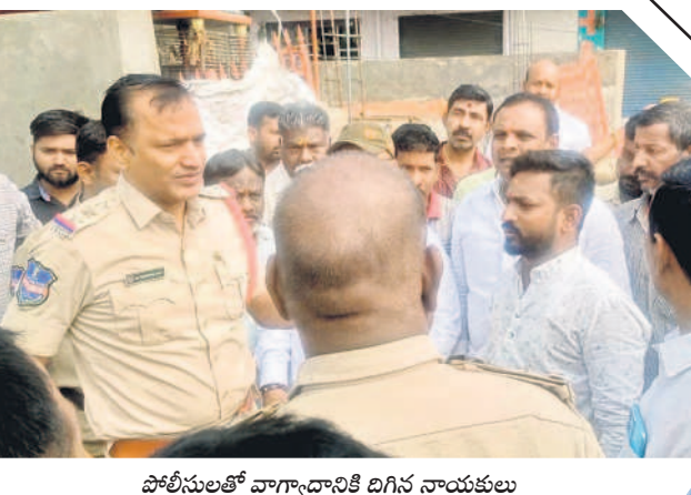
పోలీసులతో వాగ్వాదానికి దిగిన నాయకులు