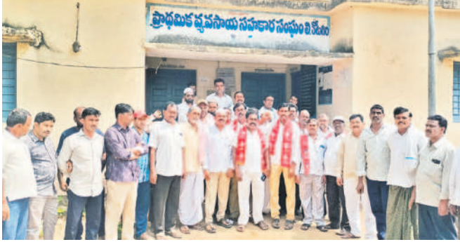
కోటగిరి సహకార సంఘం ఎదుట ధర్నా చేస్తున్న సీపీఐ నాయకులు

కోటగిరి, ఏప్రిల్ 2: రాష్ట్ర ప్రభుత్వం సన్న రకం పక్షుల ఇచ్చిన 'బోనస్'ను కాజేసిన వారిపై చట్టపరంగా చర్యలు తీసుకోవాలని కోరతూ సీపీఐ నాయకులు డిమాండ్ చేశారు. కోటగిరి ప్రాథమిక పాఠశాలను సహకార సంఘం ఎదుట రైతులతో కలిసి బుధవారం ధర్నా నిర్వహించారు. ఈ