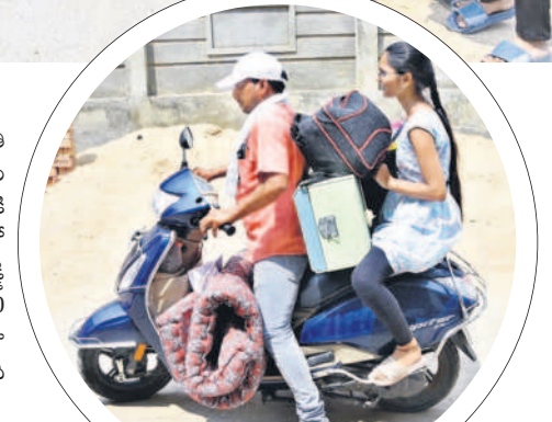
పరిశీలన ముగియడంతో విద్యార్థుల సంబంధం