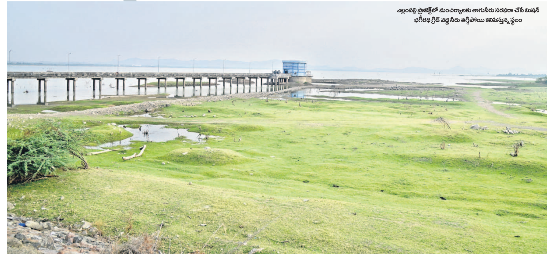
ఎల్లంపల్లి ప్రాజెక్టులో మంచిర్యాలకు తాగునీరు సరఫరా చేసే మిషన్ బగిరబ గ్రెడ్ వద్ద నీరు తగ్గిపోయి కనిపిస్తున్న స్థలం

కుటుంబం అసిఫాబాద్ (నమస్తే తెలంగాణ)/లింగాపూర్, ఏప్రిల్ 2 : కుటుంబం అసిఫాబాద్ జిల్లాలో ఉపాధి హామీ పథకం నిధులతో గ్రామాల్లో చేపట్టిన సీసీ రోడ్డు నిర్మాణ పనుల్లో నాణ్యతను పట్టించుకునే వారో కరువవుతున్నారు. ఓ వైపు రోడ్లు వేస్తుండగానే మరో వైపు పగుళ్లు తేలుతున్నాయి. పనుల్లో నాణ్యతపై పర్యవేక్షణ కొరవడంతో కాంట్రాక్టర్లు ఇష్టానుసారంగా పనులు చేస్తున్నారని ఆరోపణలు వెల్లవెత్తుతున్నాయి. జిల్లాలో రూ. 80 కోట్లతో 11 వందల పదకొండు కి.మీ సారి పంజారు కావడం, నెల వ్యవధిలోనే నీటిని పూర్తిచేయాలి అంటూ పనులు చేస్తున్నారని ఆరోపణలు వెల్లవెత్తుతున్నాయి. నిర్మాణ పనుల్లో నాణ్యతను పట్టించుకునే వారు లేక రోడ్లకు క్యూరింగ్ చేయకపోవడంతో వేసిన వారం