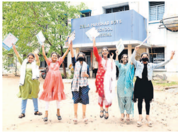
మంచిర్యాలలో పరిశ్రమల ముగిసిన అనందంలో కేరింతలు కొడుతున్న విద్యార్థులు