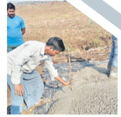
లింగాపూర్ మండల కేంద్రంలో నాణ్యత లేకుండా వేస్తున్నారని సీసీ రోడ్లను చూపిస్తున్న గ్రామస్థులు

ఈ సీసీ రోడ్డు లింగాపూర్ మండల కేంద్రంలోనిది. రూ. 5 లక్షలతో వేస్తున్న రోడ్డు నిర్మాణం మరింత దారుణంగా ఉంది. ఓ వైపు వేస్తుండగానే మరో వైపు పగుళ్లు తేలుతున్నది. రోడ్డు నిర్మాణంలో చినియోగించాల్సిన సిమెంట్, ఇసుక, కాంక్రీట్ సరిగా వేయడం లేదని మట్టిపై కప్పి కప్పి నిర్మాణం నాసిరకంగా చేపడుతున్నారని గ్రామస్థులు ఆరోపించారు. రోడ్డు నాణ్యతను అధికారులు ఎవరూ పర్యవేక్షించడం లేదని, దీంతో కాంట్రాక్టర్లు ఇష్టానుసారంగా రోడ్డు వేస్తున్నారని గ్రామస్థులు ఆగ్రహం వ్యక్తం చేశారు.