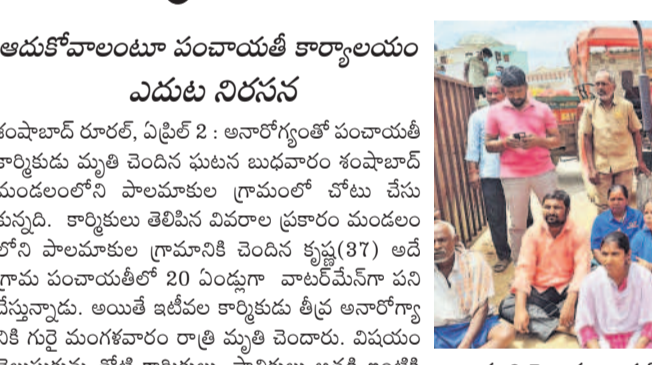
మృతి చెందిన కార్మికుడి కుటుంబాన్ని అదుకోవాలని పంచాయతీ కార్యాలయం ఎదుట ఆందోళన చేస్తున్న కార్మికులు

నాటి నుంచి కార్మికులకు ఇన్సూరెన్స్ చేయకపోవడంతో కార్మికుల కుటుంబాలు రోడ్డునపడి పరిస్థితి నెలకొన్నట్లు వారు ఆరోపించారు. కార్మికుడి కుటుంబానికి న్యాయం చేసేవరకు ఇక్కడి నుంచి కదిలేదని తెలిపారు. శంషాబాద్ తహసీల్దార్ రవీందర్ దత్ అక్కడికి చేరుకొని పూర్తి వివరాలు సేకరించి కార్మికుడి కుటుంబాన్ని అదుకుంటామని హామీ ఇచ్చారు. దీంతో కార్మికులు ఆందోళన వీరమించారు. కార్మి కుడి మృతిపై శంషాబాద్ రూరల్ పోలీసులు కేసు నమోదు చేసుకొని దర్యాప్తు చేస్తున్నట్లు తెలిపారు.