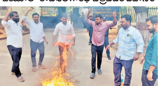
రాహుల్ గాంధీ చిత్రపటాన్ని దహనం చేస్తున్న బీఆర్ఎస్ నాయకులు