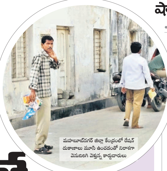
మహబూబ్ నగర్ జిల్లా కేంద్రంలో రేషన్ దుకాణాలు మూసి ఉంచడంతో నిరాశగా వెనుదిరిగి వెళ్తున్న కార్డుదారులు