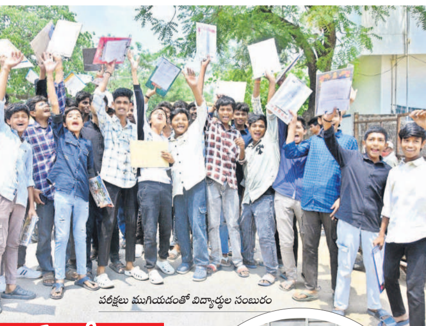
పల్లెల ముగియడంతో విద్యార్థుల సంబరం