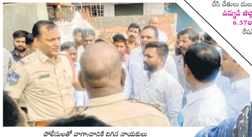
పోలీసులతో వాగ్వాదానికి దిగిన నాయకులు