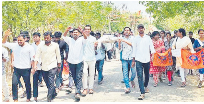
సీఎం రేపంట్ రెడ్డి దిట్టిబొమ్మకు శవయాత్ర నిర్వహిస్తున్న ఏపీపీపీ నాయకులు