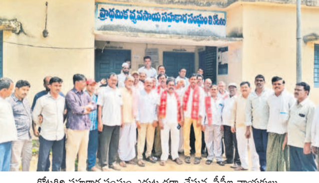
కోటగిరి సహకార సంఘం ఎదుట ధర్నా చేస్తున్న సీపీఐ నాయకులు

కోటగిరి, ఏప్రిల్ 2: రాష్ట్ర ప్రభుత్వం సన్న రకం పక్షుల ఇచ్చిన 'బోనస్'ను కాజేసిన వారిపై చట్టపరంగా చర్యలు తీసుకోవాలని కోరతూ సీపీఐ నాయకులు డిమాండ్ చేశారు. కోటగిరి ప్రాథమిక వ్యవసాయ సహకార సంఘం ఎదుట రైతులతో కలిసి బుధవారం ధర్నా నిర్వహించారు. ఈ