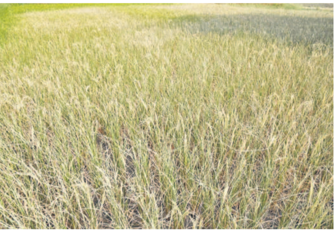
సిద్దిపేట జిల్లా ధూళిమట్ల మండలంలోని కూటిగల్ లో నీరు లేక ఎండిపోయిన రైతు చేపల్ల బలరాములు పరి పాలం