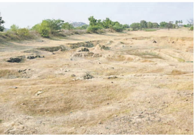
ధూళిమట్ల మండలంలోని శివాలి తండాలో ఎండిపోయిన చెరువు