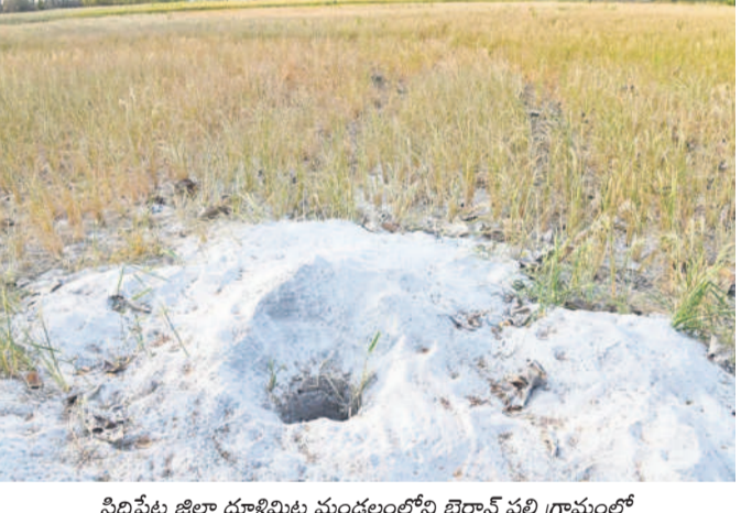
సిద్దిపేట జిల్లా ధూళిమట్ల మండలంలోని బైరాన్ పల్లి గ్రామంలో ఎండిన పరి చేసిన బతికొండుకోవడానికి కొత్తగా బోరు వేసిన రైతు