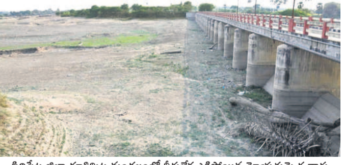
సిద్దిపేట జిల్లా ధూళిమట్ల మండలంలో నీరులేక ఎండిపోయిన మోయతుమ్మెద వాగు