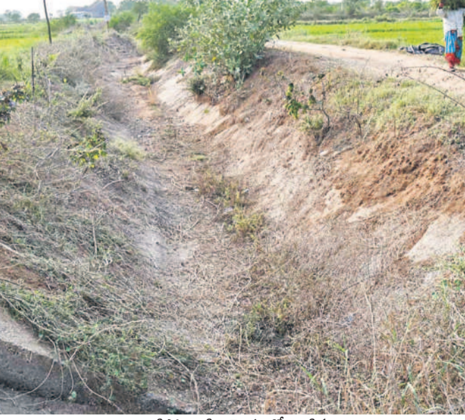
ఎండిపోయి, పీల్చి మొక్కలతో నిండిన సిద్దిపేట జిల్లా ధూళిమట్లలోని రంగనాయక సాగర్ కాల్వ