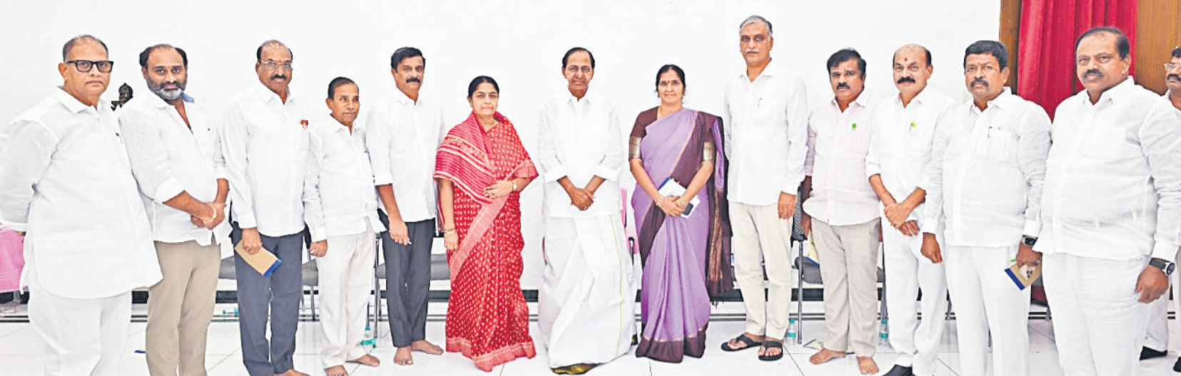
ఎర్రపల్లిలోని వ్యవసాయ క్షేత్రంలో బీఆర్ఎస్ అధినేత కేసీఆర్ తో మంగళవారం ఉమ్మడి మెడక్ జిల్లా బీఆర్ఎస్ నేతలు సమావేశం అయ్యారు. ఏప్రిల్ 27న బీఆర్ఎస్ అభివృద్ధి దినోత్సవం సందర్భంగా వరంగల్ లో నిర్వహించే బహిరంగ సభకు జన సమీకరణ తదితర అంశాలపై కేసీఆర్ వారికి దిశానిర్దేశం చేశారు. ఇప్పటి నుంచే నియోజకవర్గాల వారిగా సన్నాహక సమావేశాలు నిర్వహించుకోవాలని ఆదేశించినట్లు తెలిసింది. ప్రతి గ్రామంలో జెండాలు అవిష్కరించి జన సమీకరణ చేయాలని సూచించారు.

కెజీబీవీలో నిర్వహించే పద్ధతిగా వ్యవహరించడంతోనే విద్యార్థిని అధ్యక్షుడైంది ఇతర విద్యార్థుల తల్లిదండ్రులు ఆరోపిస్తున్నారు. చాలామంది సీబ్బింది నైట్ డ్యూటీకి గైర్జాబరుతున్నారని, ఒకరిద్దరు తప్పా మిగతావారు సమయపాలన పాటించడం లేదని, అయినా చర్యలు తీసుకోవడం లేదనే ఆరోపణలు ఉన్నాయి. పాఠశాల చుట్టూ ప్రహారీ ఉన్నా విద్యార్థి ఉదయం అందించే అనంతరం అధ్యక్షుడు కావడం వెనుక అధికారుల నిర్లక్ష్యం కొట్టొచ్చిందని కనీసం నంది. ఈ విషయమై డిఈవోతోపాటు బాలనందం సీబ్బిందికి సమాచారం ఇవ్వడంతో వారు పాఠశాలకు చేరుకొని విచారణ జరిపేందుకు తెలిసింది.