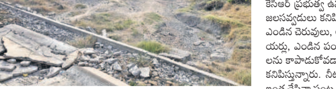
చేర్యాల వద్ద ఎండిన మోయ తుమ్మెద వాగు

సిద్దిపేట, ఏప్రిల్ 02(సమస్త తెలంగాణ ప్రతినిధి) : సిద్దిపేట జిల్లాలోని చేర్యాల, ధూళిమట్ల, మద్దూరు, కొమురవెల్లి మండలాలలో సాగునీరుందక వేలాది ఎకరాల్లో పరిపంబు ఎండిపోతున్నది. బీఆర్ఎస్ హయాంలో ఏటా సాగునీటిని విడుదల చేసి, ఈ ప్రాంతం చెరువులు, కుంటలు పూర్తిగా నింపడంతో పుష్పలంగా పంటలు పండ్లాయి. చెరువులు, కుంటలు, వాగులు ముందుటిందల్లో జలకళతో ఉట్టిపడ్డాయి. కాంగ్రెస్ ప్రభుత్వం వచ్చాక ఆ పరిస్థితి లేదు. ప్రస్తుతం ఎటుచూసినా నెర్రెలిడిన పొలాలు, బోసిపోయిన చెరువులు, వాగులు కనిపిస్తున్నాయి. పొలాలు ఎండిపోవడంతో రైతులు పశువులకు వదిలేశారు. కొంతమంది రైతులు వివిధ పంటలు కాపాడుకోవడానికి అప్పులు తెచ్చి బోర్లు