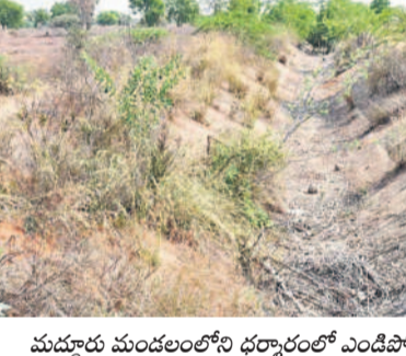
మద్దూరు మండలంలోని ధర్వారంలో ఎండిపోయిన దేవాదుల కాలువ

జనగామ నియోజకవర్గంలోని చేర్యాల ప్రాంతంలో తపానోపల్లి, లద్దూరు రిజర్వాయర్లు ఉన్నాయి. బీఆర్ఎస్ పాలనలో ఈ రెండు రిజర్వాయర్లకు నీటిని నింపి ఈ ప్రాంతాన్ని సస్యశ్యామలం చేశారు. ప్రస్తుతం రిజర్వాయర్ల నుంచి నీళ్లందక చేర్యాల, కొమురవెల్లి, మద్దూరు, ధూళిమట్ల మండలాలలో పంటలు జనగామ జిల్లాలోని