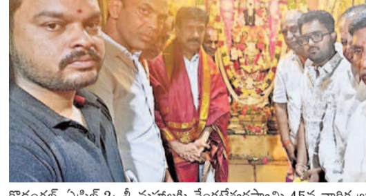
కొండగల్, ఏప్రిల్ 2: శ్రీ మహాలక్ష్మి వేదభోజనసామితి 45వ వార్షిక బ్రహ్మోత్సవాలను పురస్కరించుకొని బుధవారం స్వామివారికి బంగారు రతనం అందజేశారు. సందర్భంగా జాతర స్థలంలో ఎద్దులతో బండలాగుడు పోటీలను ఆయన ప్రారంభించారు. పోటీల్లో విజేతలుగా నిలిచిన ఎద్దులకు వెండితో కూడిన ప్రదర్శన, ద్వితీయ, తృతీయ బహుమతులను అందజేశారు. కార్యక్రమంలో బీఆర్ఎస్ నాయకులతో పాటు భక్తులు పాల్గొన్నారు.