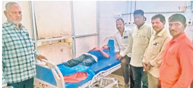
దవాఖానంలో చికిత్స పొందుతున్న మున్సిపల్ కార్మికులను పరామర్శిస్తున్న సీబిటియూ నాయకులు