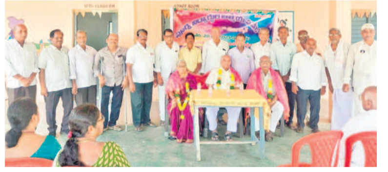
గురువులను సన్మానిస్తున్న 1972-73 బ్యాచ్ పూర్వ విద్యార్థులు

పెద్దమందడి, మార్చి 20 : మండలంలోని బిలిజపల్లి, జంగంపాపల్లి ఉన్నత పాఠశాలలో 1972-73 ఏడో తరగతి బ్యాచ్ కు చెందిన పూర్వ విద్యార్థులు బుధవారం ఆత్మీయ సమ్మేళనం నిర్వహించారు. వివిధ రంగాల్లో స్థిరపడిన వారంతా 51 ఏండ్ల తర్వాత కలుసుకున్నారు. ఈ సందర్భంగా