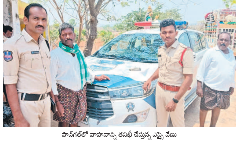
పాన్ గల్ లో వాహనాన్ని తనిఖీ చేస్తున్న ఎస్పి వేణు

వనపర్తి టౌన్, మార్చి 20 : పార్లమెంట్ ఎన్నికల నియమావళిలో భాగంగా జిల్లావ్యాప్తంగా నిర్వహించిన పోలీస్ తనిఖీల్లో రూ.5.37,500 నగదుతోపాటు 35.39 లీటర్ల మద్యం సీజ్ చేసినట్లు పోలీస్ అధికారులు తెలిపారు. పోలీస్ పోలీస్ స్టేషన్ లోని క్యాఫెటెరియా ఎక్స్ ప్రోజెక్టు వద్ద రూ.3.47లక్షలు, 25.25 లీటర్ల మద్యం, పెట్రోలు చెక్ పోస్టు వద్ద రూ.79,500 నగదు, అమరబింత పరిధిలోని నాగల్ కడపూర్ చెక్ పోస్టు వద్ద రూ.11వేల నగదు, భిల్లాభుజులపూర్ పోలీస్ స్టేషన్ పరిధిలో 8.8 లీటర్ల మద్యం, వీవనగండ్ల పోలీస్ స్టేషన్ పరిధిలో 7 లీటర్ల మద్యం, గోపాలపేట పోలీస్ స్టేషన్ పరిధిలో