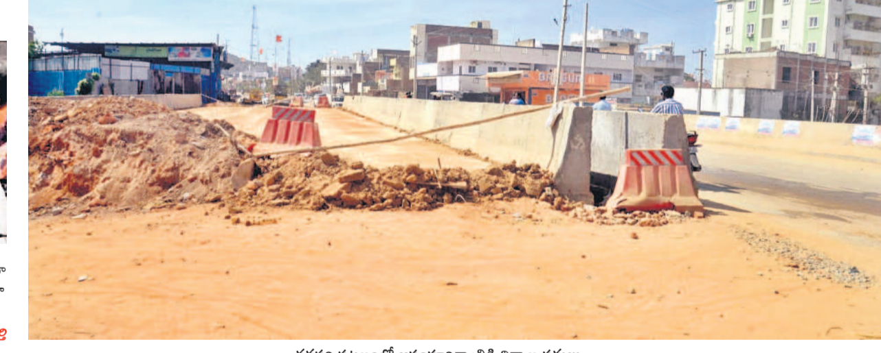
వనపర్తి పట్టణంలో అసంపూర్ణగా ట్రీడి నిర్మాణ పనులు

జిల్లా కేంద్రంలో మిగిలిన రోడ్డు విస్తరణ పనులను పూర్తి చేయాలంటే అడ్డంకులను తొలగించాలి. విద్యుత్ స్తంభాలు తొలగించడంతోపాటు డ్రైనేజీ నిర్మాణాలు చేపట్టాలి. ఇవి పూర్తి చేస్తే మిగిలిన రోడ్డు పనులను కొనసాగిస్తాం. మున్సిపాలిటీ, విద్యుత్ శాఖ పరిధిలో ఉన్న పనులను చేపడితే మూ పని చేయడం సులభమవుతుంది. మొత్తంగా పెండింగ్లో ఉన్న పనులకు చేయాలనుకుంటున్నాం. దీని కోసం కాంట్రాక్టర్లను కూడా సంప్రదిస్తున్నాం. - డెప్యూ నాయక్, ఈఈ, రోడ్డు భవనాల శాఖ, వనపర్తి